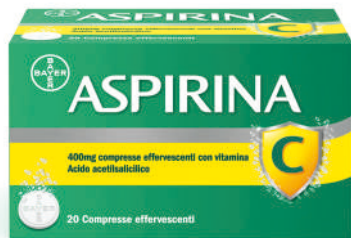
ASPIRINA C 400+240 mg 20 compresse effervescenti