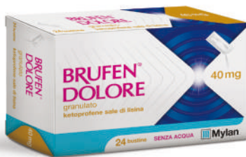
BRUFEN DOLORE 40 mg 24 bustine granulato