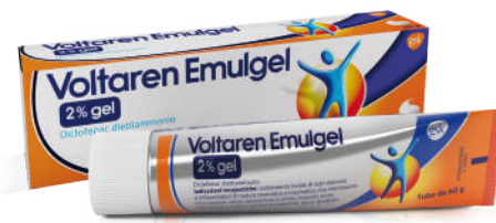
VOLTAREN EMULGEL 2% GEL Tubo 60 g