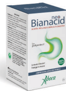
NEOBIANACID 45 compresse masticabili